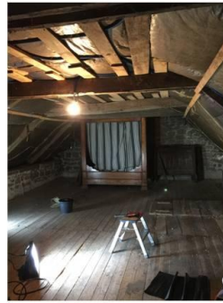
Début du chantier, enlèvement de la laine de verre