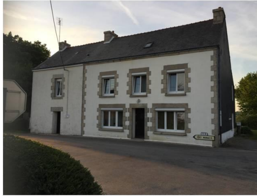
Maison construite en 1910 à isoler