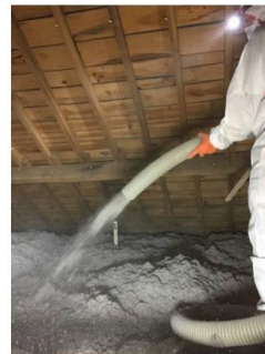
Soufflage de ouate de cellulose – 35 cm d'épaisseur après tassement