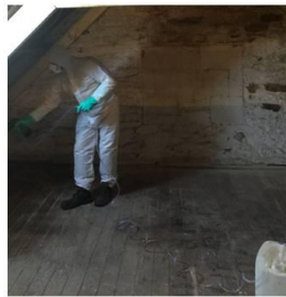
EPI pour la mise en place du traitement