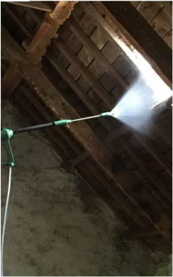
Traitement et protection des bois avant isolation