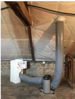
VPH – Ventilation Positive de l'Habitat hygrorégulée Prise d'air par l'extérieur, tempéré dans la VPH, diffusé par le plafond